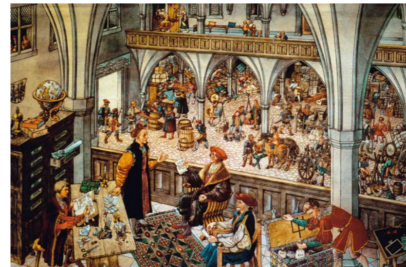
Schon 1486 sprach der Augsburger Rat erstmals von der Bank des Ulrich Fugger und seiner Brüder.